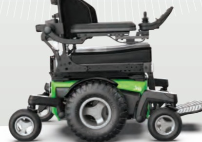
Ruedas Crossover de 14" para una suspensión y confort adicionales (base de 635mm)