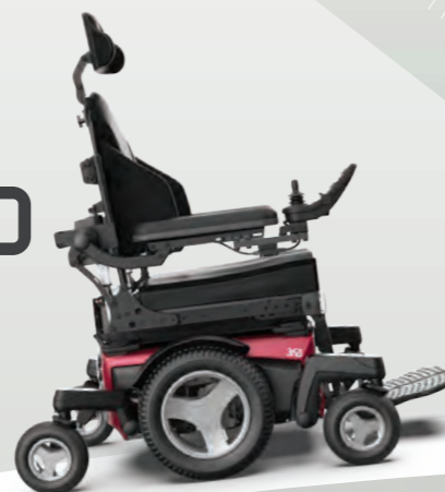
Ruedas Urban de 14" para una excelente conducción urbana (base de 610mm)

Elige entre 3 tipos de ruedas intercambiables Con Magic 360 y la versatilidad que ofrecen sus 3 tipos de ruedas puedes moverte en espacios interiores o en terrenos donde necesitas mayor tracción.