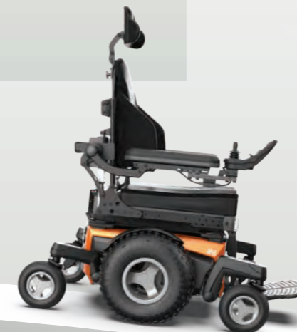
Ruedas off-road de 14" para la mejor tracción en exteriores (base de 660mm)

CONFIGURA TU SILLA PARA ADAPTARLA A TI, A DONDE QUIERAS IR Y A LO QUE QUIERAS HACER