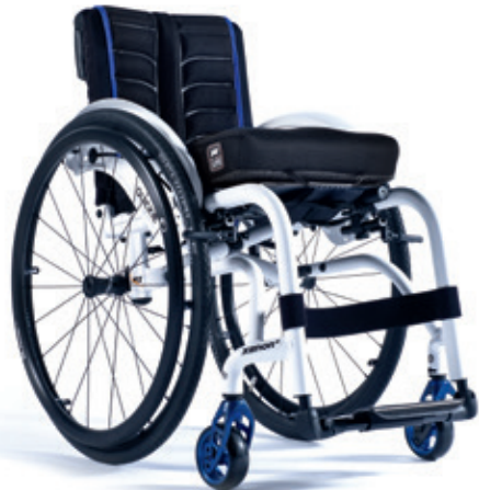
XENON 2 Armazón híbrido reforzado LA MÁS RESISTENTE