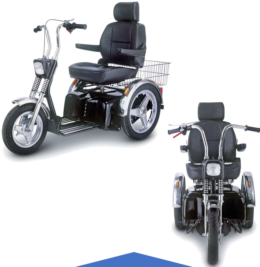
Afiscooter SE Monoplaza