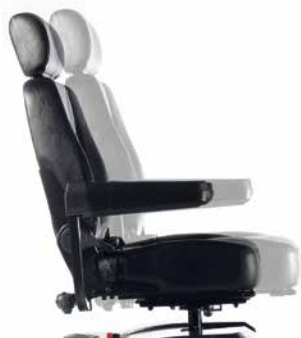
Asiento deslizante, ajustable en profundidad

Gracias al manillar ajustable con amplias empuñaduras ergonómicas, podrás encontrar fácilmente la posición de conducción que te resulte más cómoda. Con asiento y respaldo acolchado de gran calidad para ofrecerte el máximo confort en cada viaje. La unidad de asiento es ajustable en altura, ángulo y profundidad y los reposabrazos pueden ajustarse en anchura, ángulo y profundidad o abatirse totalmente para facilitar el acceso.