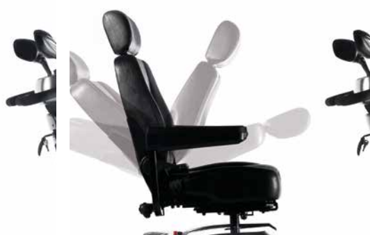
Ajuste sencillo del ángulo de respaldo