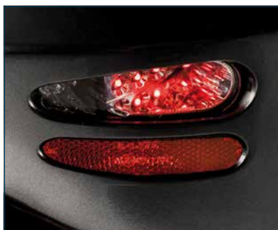
Luces de posición y frenado en la parte trasera.

Gracias a su avanzada tecnología de iluminación LED de bajo consumo, las luces de los scooters Serie-S son 400 veces más eficientes que las bombillas normales, lo que se traduce en un mayor ahorro de energía en la batería y por tanto una mayor autonomía de viaje. Así podrás disfrutar de tu scooter por más tiempo.