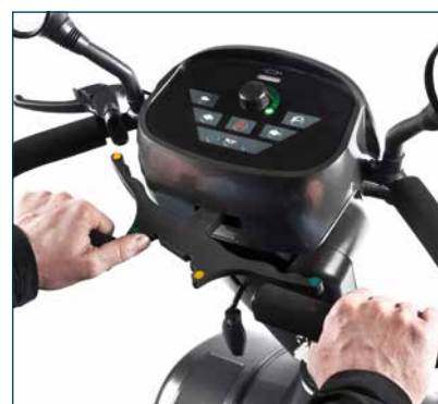
Panel de control táctil y waterproof que ofrece un ajuste sencillo de la velocidad, indicador de batería de LED y bocina.