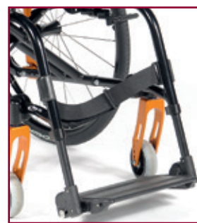
Armazón con reposapiés fijos. Disponible a 105° o 95° y también con curvatura de reposapiés de 2 cm.