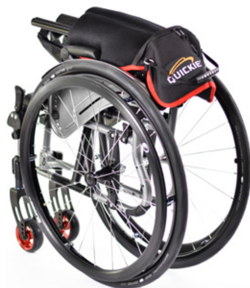
Quickie Life con opción de respaldo plegable