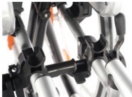
Sistema innovador de autobloqueo del plegado