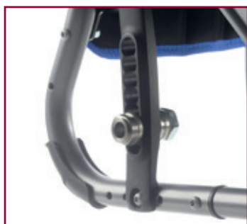
Altura de asiento ajustable en 7 posiciones y con 4 posiciones del camber (de 0 a 4°).

En su configuración standard Quickie Life permite un gran número de ajustes: ajustes de la altura delantera y trasera de asiento, ajuste del camber, ajuste en ángulo de la horquilla... y también ofrece una completa gama de opciones incluyendo reposabrazos, protectores laterales, reposapiés y frenos para hacer de tu Quickie Life una silla única.