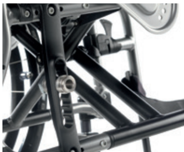
Cruceta de 3 brazos que garantiza una mayor robustez

Quickie Life incorpora además un innovador sistema de autobloqueo del plegado que fija automáticamente la posición de la silla cuando se pliega para facilitar su manejo y apertura. Y con las dimensiones más compactas!!