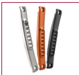
Múltiples posibilidades de personalización Marca tu estilo con una selección de 3 colores anodizados para la pletina del eje y/o la horquilla.