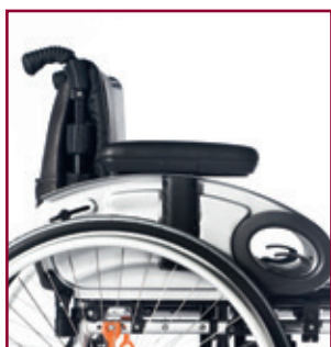
La más amplia gama de opciones disponible Como reposacabezas, mesas, reposabrazos de escritorio o hemipléjicos, soporte de amputados...