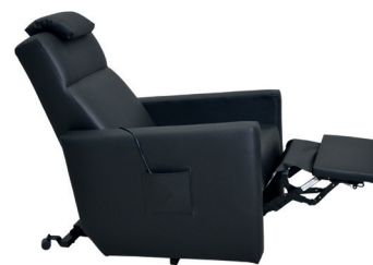
Faro Polipiel Negro

El sofá Faro y Fino de 1 motor permiten levantar el reposapiés y reclinar el respaldo en un único movimiento simultáneo. La versión del Faro de 2 motores permite el ajuste individual del respaldo y el reposapiés.