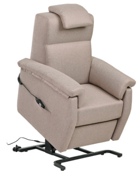
Fino Heritage Camel