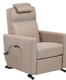
Faro Heritage Camel

Función de distancia a la pared : requiere una separación de 90mm para las versiones de 1 motor.